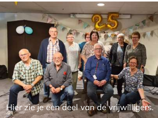
Hier zie je een deel van de vrijwilligers.