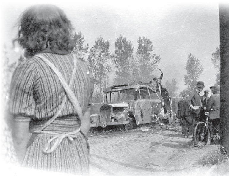
De ravage op het Vogelfort die daar achterbleef na de bevrijding.

De Poolse tanks reden naar ons dorp Hengstdijk. En we waren bevrijd. Overal stonden nu tanks met Poolse soldaten.