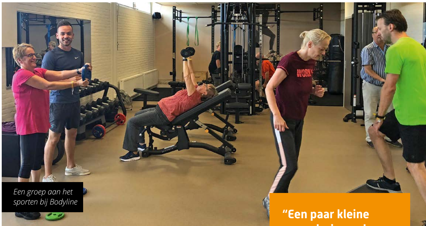
Een groep aan het sporten bij Bodyline

Het diabetes-wandel-project werd het bij aanvang genoemd, maar het is inmiddels meer dan wandelen met mensen met diabetes. Hart- en vaatpatiënten, diabetici en mensen met overgewicht lopen zes maanden lang 1 uur per week met een groep, gaan bovendien een uur per week gezamenlijk sporten bij Bodyline en in groeps gesprekken met leefstijladviseur Ruben Haverbeke leren ze omgaan met hun aandoening. De onderlinge sfeer en het lotgenotengevoel werken positief en het helpt ook dat de zorgverzekeraar meedoet. Het zit inmiddels in het basispakket wat het betaalbaar en toegankelijk voor velen maakt.