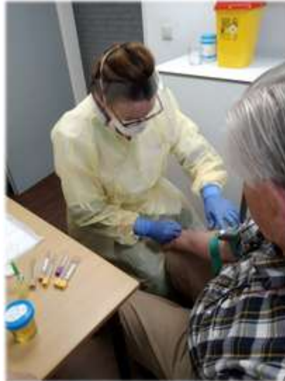
Afbeelding 4 Bloedprikken bij een coronapatiënt