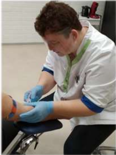
Afbeelding 3 Bloedprikken in coronatijd