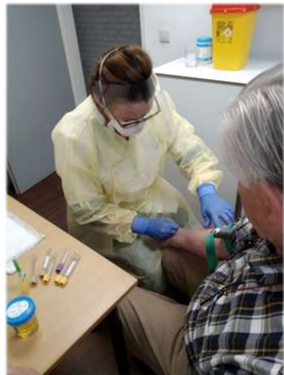
Afb. 4 Bloedprikken bij een coronapatiënt