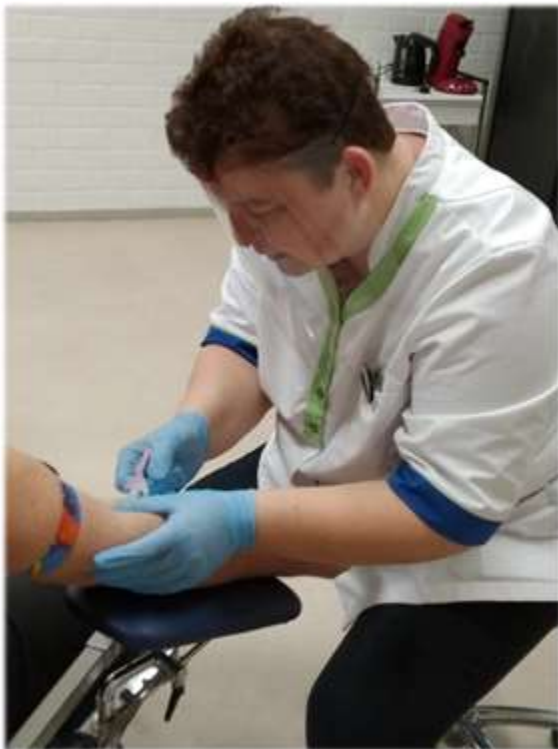
Afb. 3 Bloedprikken in coronatijd

< Afb. 2 Medewerker bloedafname met prik- en transportkoffer