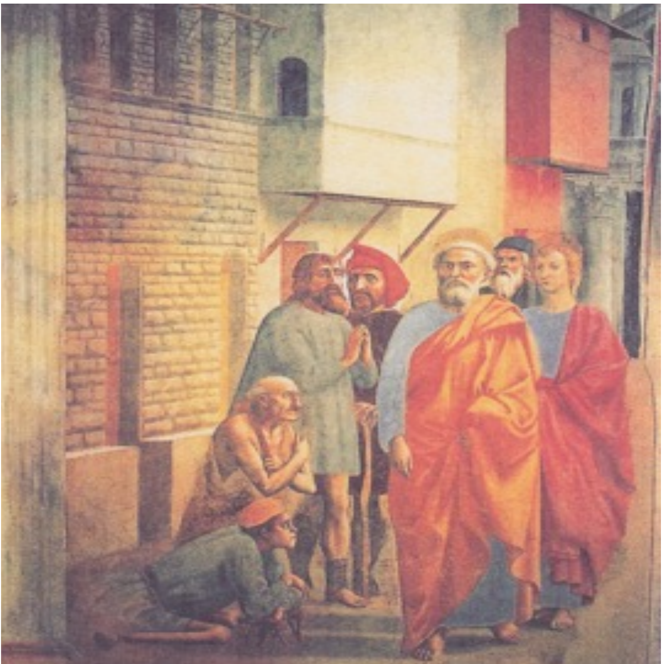
Het optreden van de apostelen blijft ook niet onopgemerkt; veel zieken werden genezen Hand. 5 : 15. De Apostel Petrus geneest zieken met zijn schaduw. Fresco v. Tomasso Massaccio Florence (ca. 1425)

Naast het evangelieboek van Lucas, is er ook een vervolg geschreven. Dat boek kennen wij onder de titel: Handelingen der Apostelen. De aanhef van dat tweede boek is opvallend gelijk aan die van zijn eerste boek: het is gericht aan iemand die Theofilus heet. In zijn eerste boek schrijft Lucas aan 'hoogedele' Theofilus, in het vervolg blijft dat achterwege. Blijkbaar is Theofilus Christen geworden: vriend van God. Een andere titel zou kunnen zijn: Geschiedenis over de Apostelen (in Duitse taal; Apostelgeschiedenis). Lucas geeft met tussenpozen een soort algemeen overzicht van de situatie in en rond Jeruzalem na de opwekking van Jezus. Hij is daar zelf geen ooggetuige van geweest, maar hij heeft zo veel mogelijk de verhalen die daarover bekend waren verzameld en ordelijk opgesteld. Ze geven een geïdealiseerd beeld van de ontwikkeling en het leven van de eerste christelijke gemeente. Christenen worden voorgesteld als vrome Joden die dagelijks een bezoek brengen aan de Tempel (Hand. 3:1).